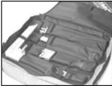
Sac de transport